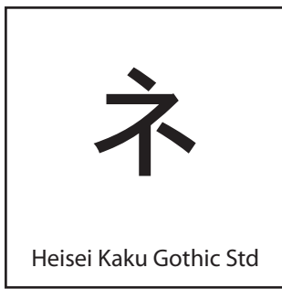
Heisei Kaku Gothic Std