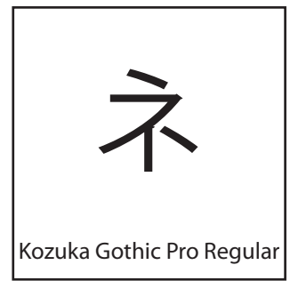
Kozuka Gothic Pro Regular