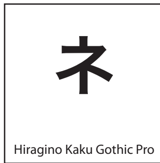
OTF, Dainippon Screen/Apple