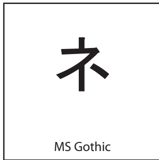
TTF, Ricoh Ltd/Microsoft