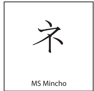
TTF, Ricoh Ltd/Microsoft